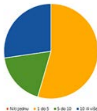
Koliko knjiga pročitate godišnje?