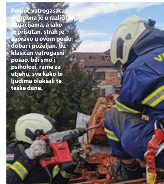
Pomoć vatrogasaca potrebna je u različitim situacijama, a iako je prisutan, strah je zapravo u ovom poslu dobar i poželjan. Uz klasičan vatrogasni posao, bili smo i psiholozi, rame za utjehu, sve kako bi ljudima olakšali te teške dane.

i provjeravali ako su ljudi dobro. Ostale dane radili smo na uklanjanju dimnjaka i srušenih građevinskih dijelova s oštećenih kuća budući da su oni prijetili rušenjem ili padanjem na prometnice i nogostupe. Radilo se od ranog jutra do noći. Ipak, najteži dio posla bio je susret s ljudima stradalima u potresu. Ne možete ostati ravnodušni gledajući ih tako na dvorištima i na ulici, pritom znajući da su mnogi od njih ostali doslovno bez krova nad glavom. Njihove priče dirnule su i najčvršće među nama. Uz klasičan vatrogasni posao, bili smo i psiholozi, rame za utjehu, sve kako bi ljudima olakšali te teške dane. Upravo psihološki aspekt našega posla često je zapravo teži od samog fizičkog.