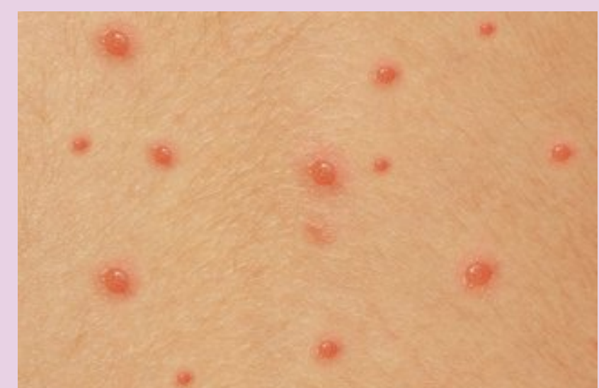
Slika 2. Simptom Varicelle - osip