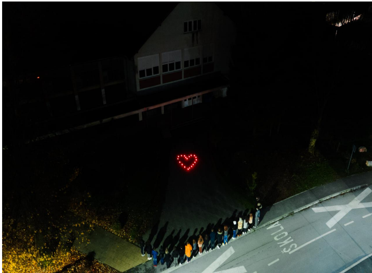
Obilježavanje Dana sjećanja na žrtve Domovinskog rata i Dana sjećanja na žrtvu Vukovara i Škabrnje