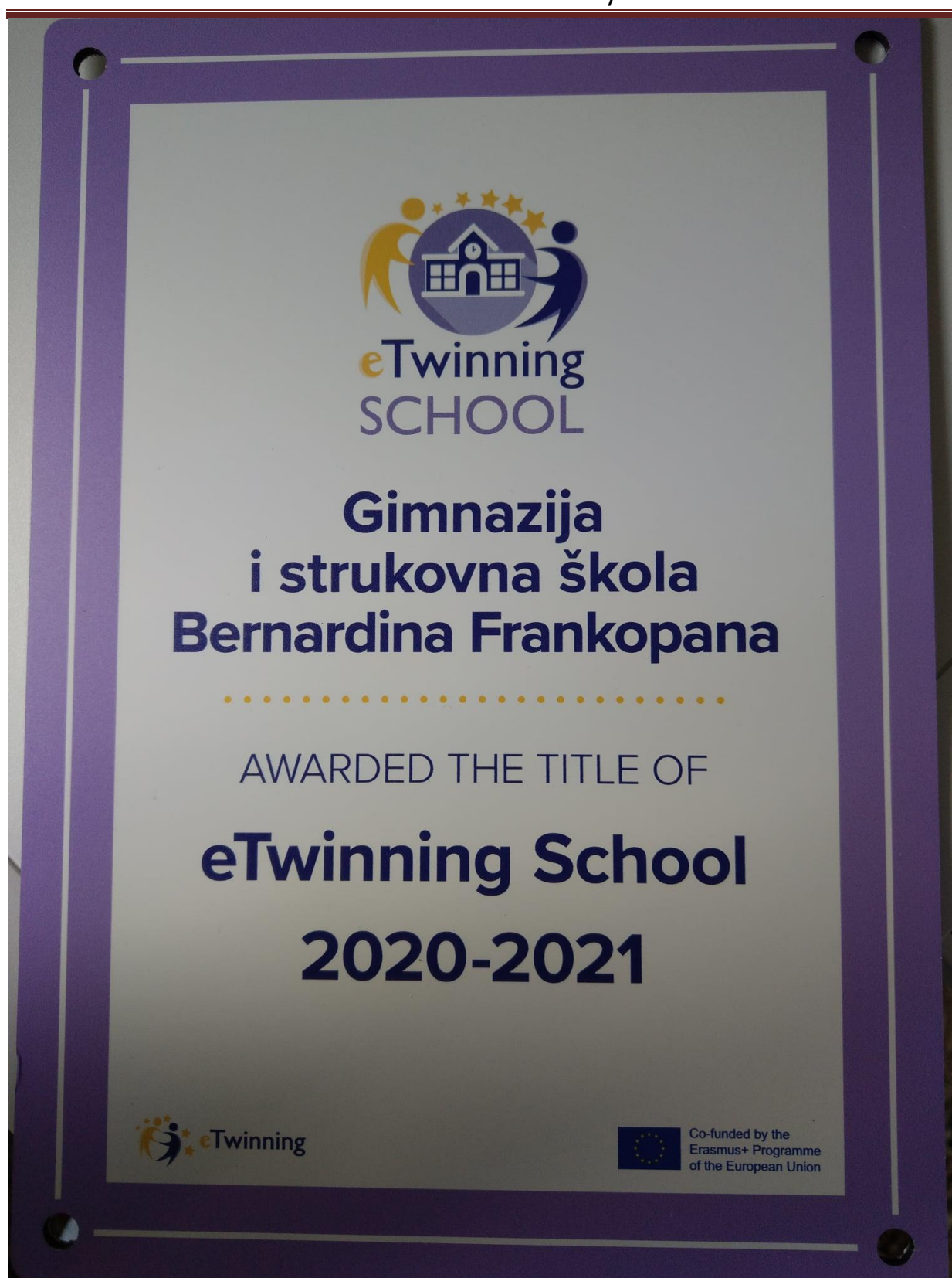
Titula eTwinning škole