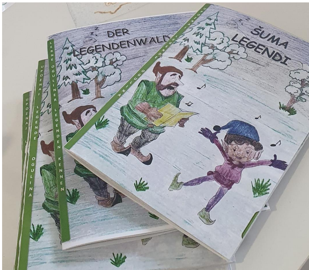
Slikovnica Šuma legendi Učeničke zadruge „Klečka čarolija“