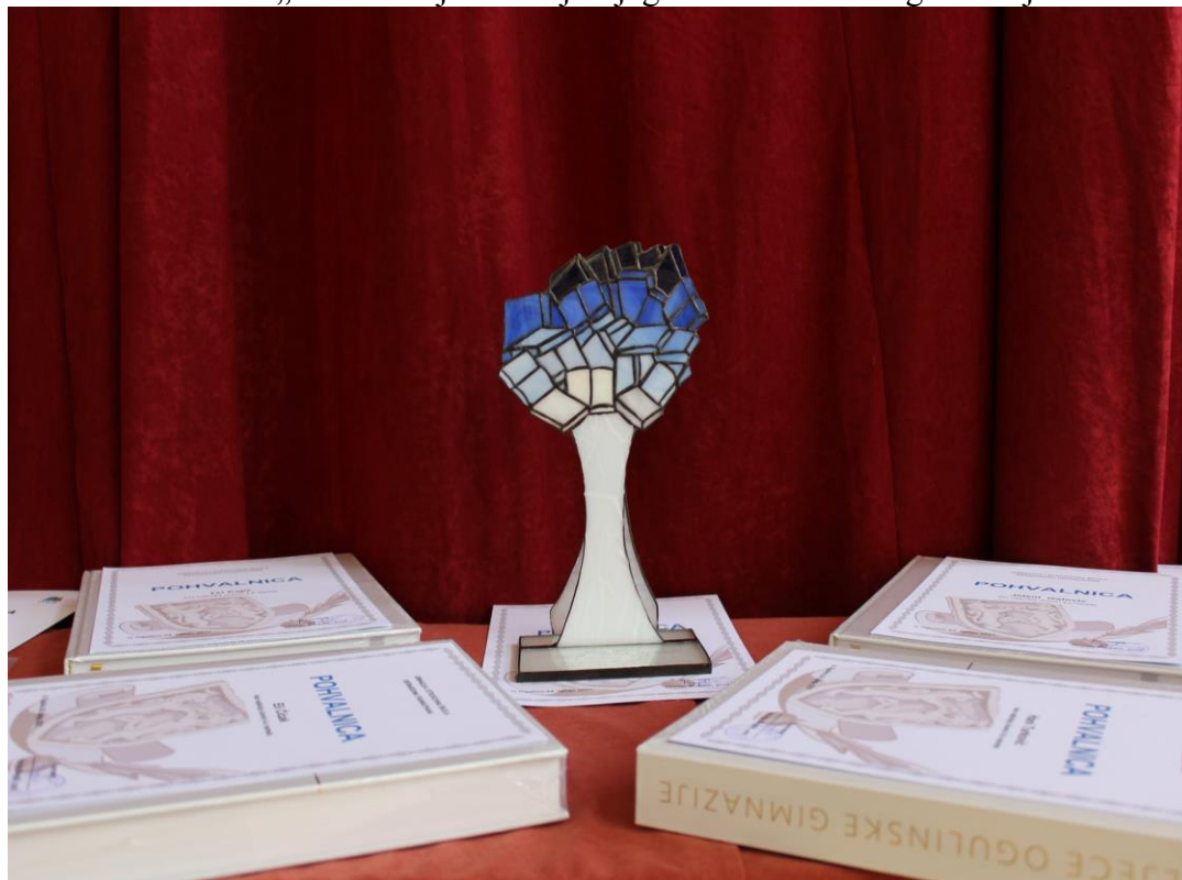
Statua „Drvo znanja“ za najboljeg učenika/učenicu generacije