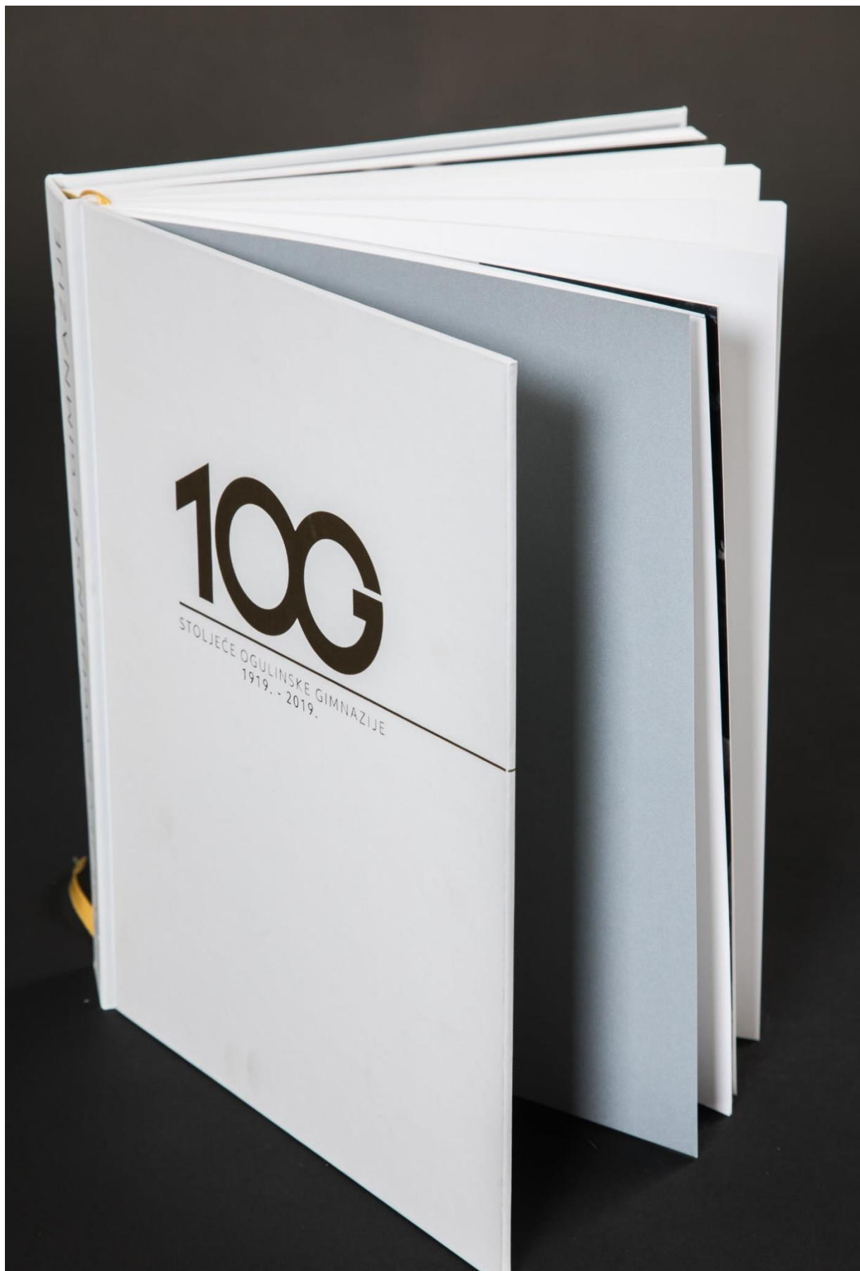
Monografija škole Stoljeće ogulinske Gimnazije