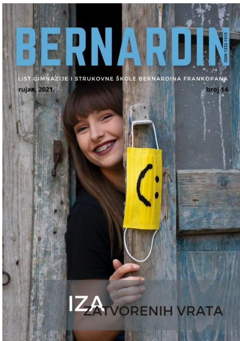
Školski list Bernardin