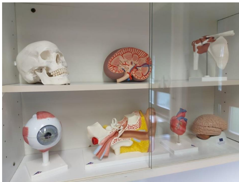
Novi anatomske modeli za kabinet Biologije i Kemije