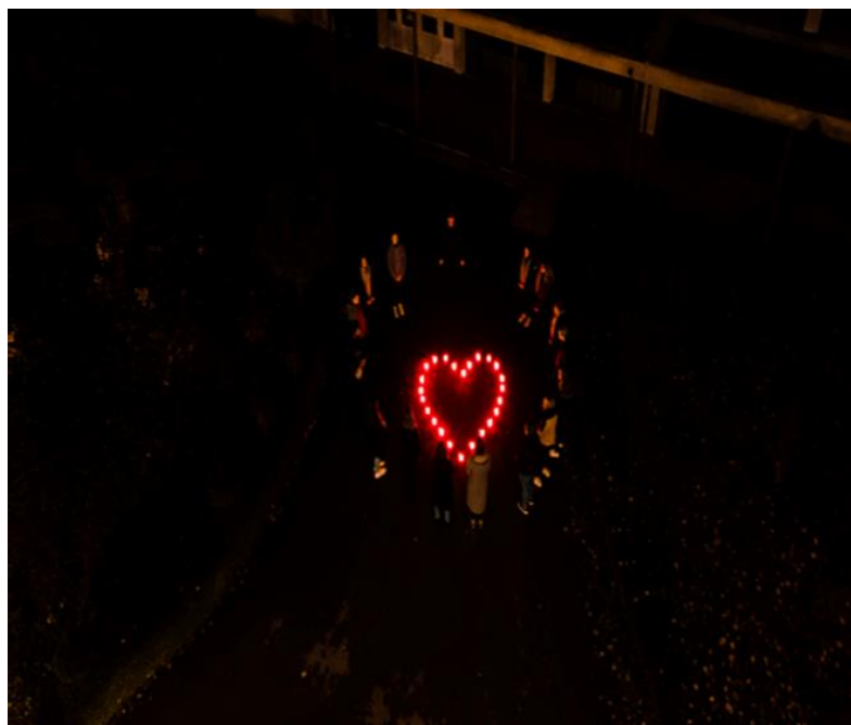
Obilježavanje Dana sjećanja na žrtve Domovinskog rata i Dana sjećanja na žrtvu Vukovara i Škabrnje