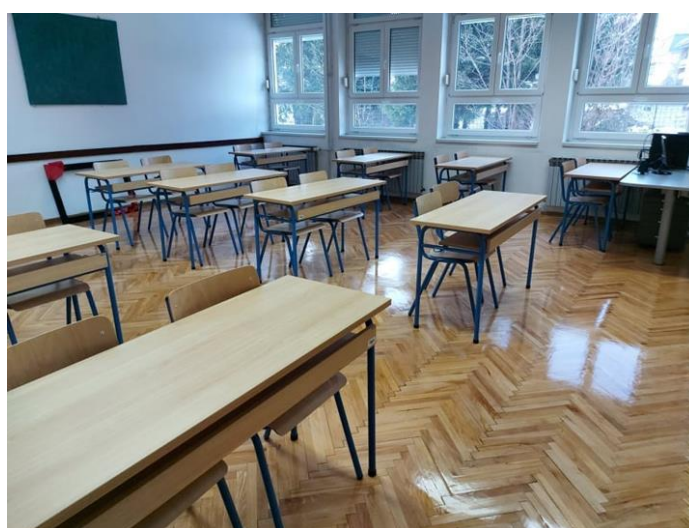
Nastavak uređivanja kabineta (brušenje i lakiranje parketa, novi namještaj)