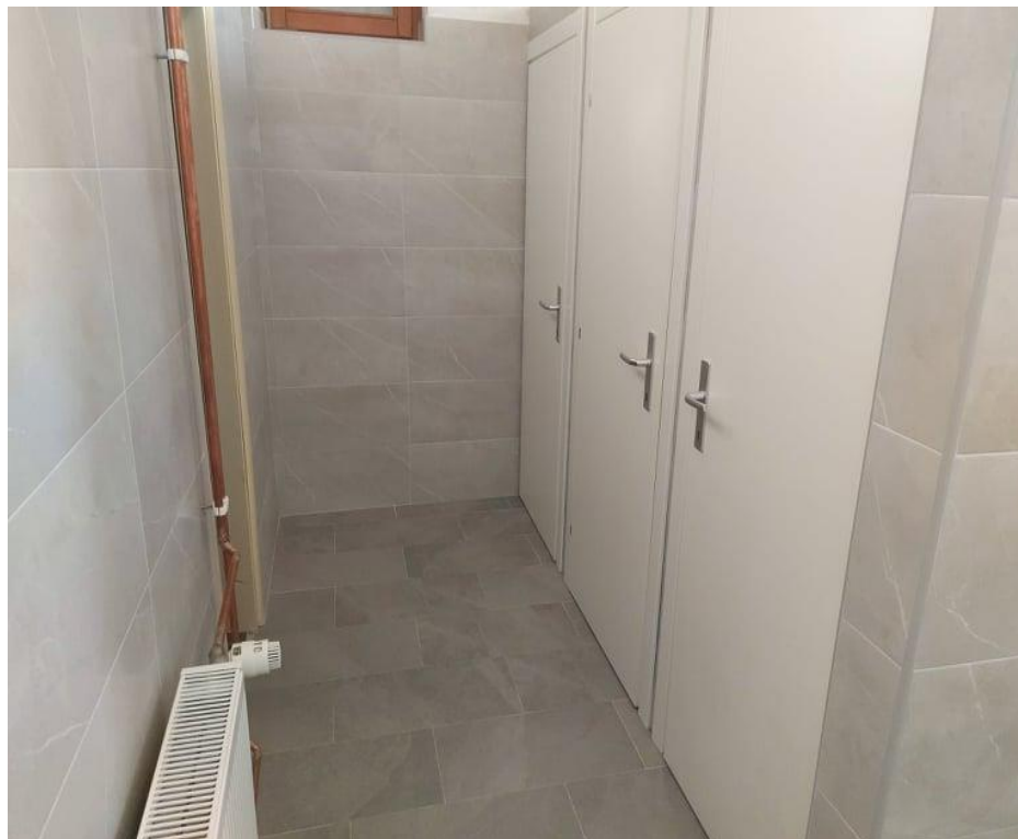
Uređeni sanitarni čvorovi