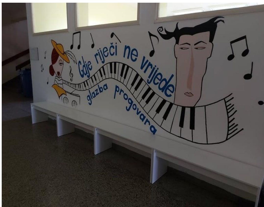
Oslikani zidovi škole i nove garderobne klupe