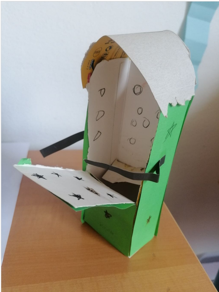
Klara Batinić, 4.a PERILICA POSUĐA