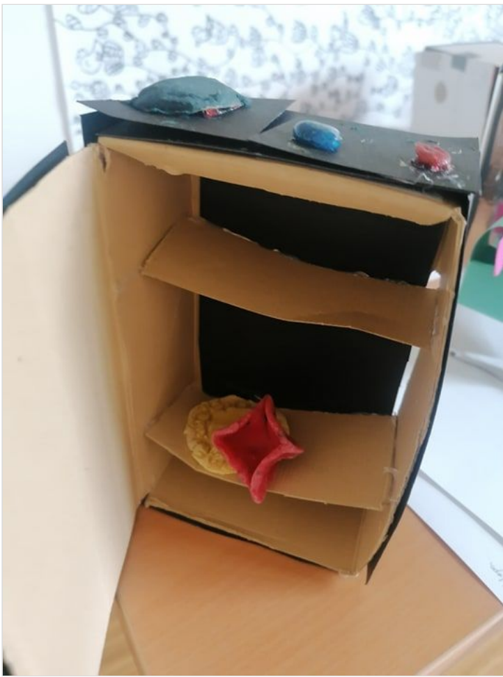
Učenica Klara Batinić, 4.a