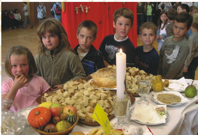
Zahvalnost za plodove zemlje obilježavamo posvetom Hrane i plodova zemlje.