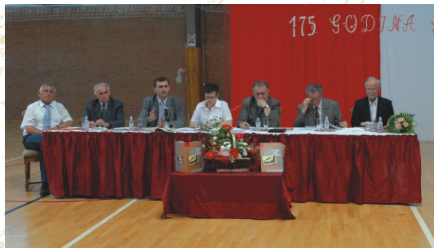
175. obljetnica škole