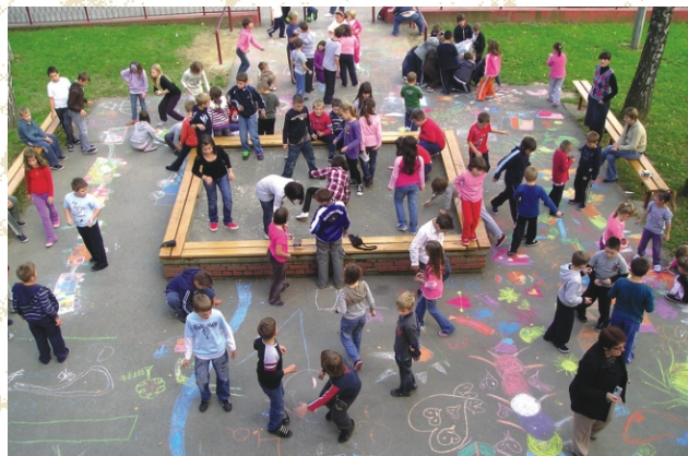
Dječji tjedan obilježavamo prigodnim sadržajima i aktivnostima.