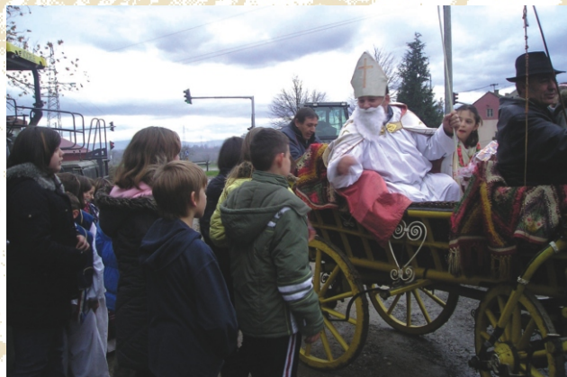
Tradicionalno svake godine organiziramo Doček sv. Nikole i podjelu prigodnih darova.