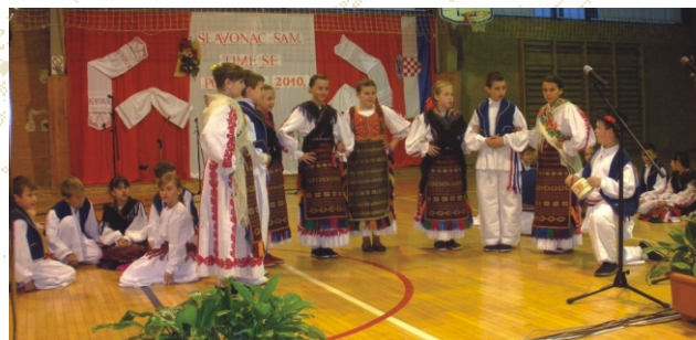
Članovi školskoga folklor U suradnji s KUD-om Rešetari nastupaju na manifestacijama Rešetarima za Božić i Slavonac sam , time se ponosim.