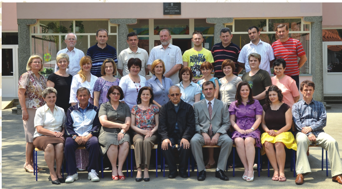
Djelatnici škole u šk. god. 2010./2011.

Legenda: U-učitelj; P-pedagog; Knj.-knjižničar; Rav.-ravnatelj; T-tajnik; R-računovođa; K-kuhar; D-domar; Č-čistač