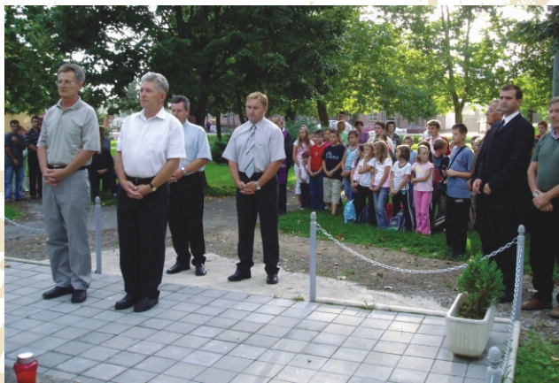
Manifestacija Da se ne zaboravi tradicionalno je sjećanje na poginule branitelje našega kraja koju škola organizira u suradnji s Općinom Rešetari, Udrugom roditelja Poginulih branitelja i crkvom.