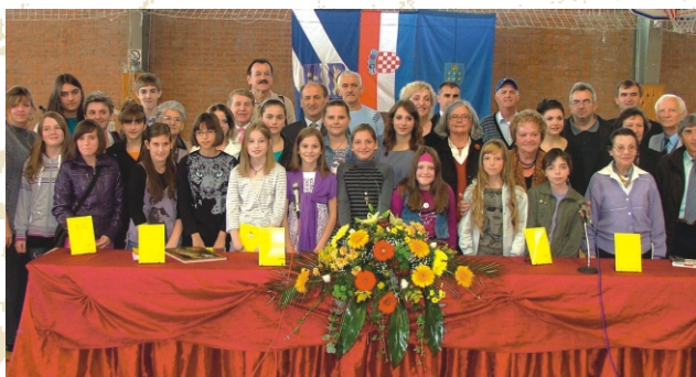
U suradnji s KLD-om Rešetari svake godine u prostoru škole organizira se susret učenika i učitelja s pjesnicima iz dijaspore i domovine.