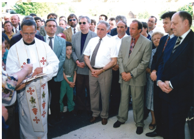
Otvaranje školske dvorane