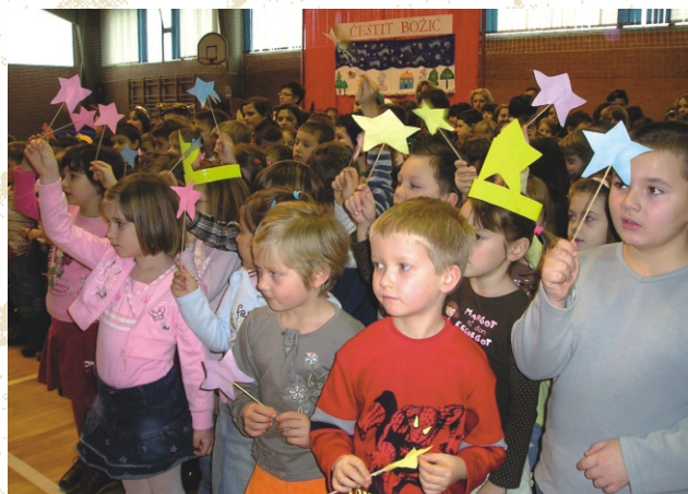
Povodom božićnih blagdana organiziramo integriranu nastavu, božićne priredbe te prigodne božićne sajmove Ispred crkve u Rešetarima.