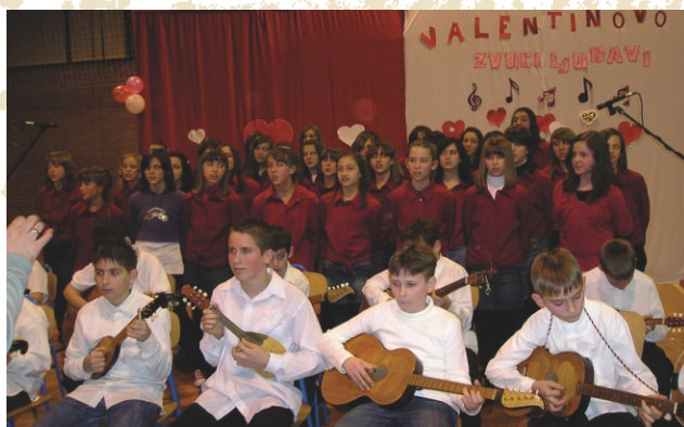
Valentinovo - tradicionalna proslava u školi.