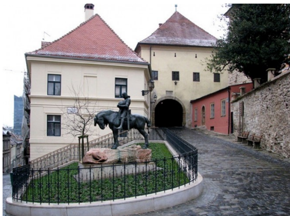
Kamenita vrata – ulaz iz Radićeve ulice

TAKO I ZA DRUGU I TREĆU ZNAMENITOST; SVAKA NOSI PO 3 BODA. (Znamenitosti mogu biti građevine, parkovi, gradske četvrti, sportski objekti, plaže, muzeji, festivali, kulturno-zabavne manifestacije...)