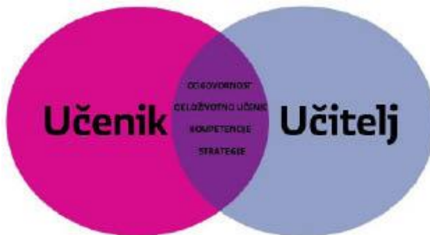
Slika 4: Grafički prikaz odnosa učenika i učitelja

S obzirom na to da je prirodan način usvajanja jezika njegova upotreba i stalna komunikacija, jedan je od objektivnih preduvjeta za ostvarivanje komunikacijskoga pristupa i učinkovito učenje i poučavanje engleskoga jezika rad s manjim brojem učenika u skupini. Preporučuje se grupiranje učenika u obrazovne skupine, ne veće od 15 učenika, unutar jednoga razreda na temelju rezultata dijagnostičkoga mjerenja koje se provodi svake godine uz neophodno omogućivanje horizontalne prohodnosti. Takvo se grupiranje preporučuje od šestog razreda nadalje, vodeći računa o tome da se mješovitim razrednim odjeljenjima u srednjim strukovnim školama omogući podjela prema zanimanjima kako bi se osiguralo adekvatno ovladavanje jezikom struke te da se učenicima kojima je engleski drugi strani jezik prepusti odluka žele li učiti jezik kao početnici ili nastavljači. Grupiranje učenika regulira se kurikulumom škole.