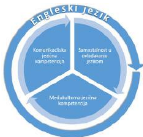
Slika 3: Prikaz zastupljenosti domena u kurikulumu nastavnog predmeta Engleski jezik

Sve tri domene kurikuluma nastavnog predmeta Engleski jezik imaju jednaku postotnu zastupljenost u svim godinama učenja i poučavanja.