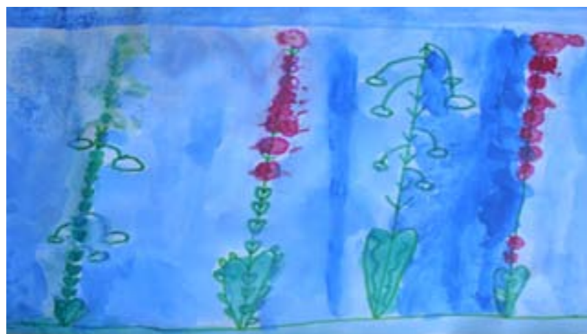
M. J. 3.b

Sunce se budi. Probudiše se ljudi. Zelena trava ugledala mrava. Cvijeće je crvene boje, baš kao i srce moje. Leptiri lete. Pogledaj svijete. I ptice pjevaju pjesmicu svoju probudiše ljubav moju. E, proljeće, ljepota tvoja najveća je sreća moja.