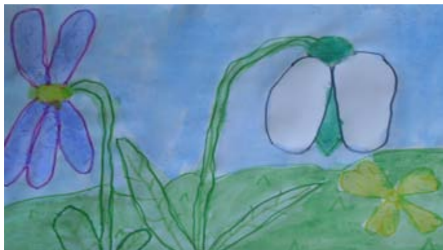
L. i K. 3.b

Sunce je izašlo. Djecu van pozvalo na veselu igru kako bi se svako dijete zabavilo.