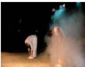
Predstava “Galeb Jonathan Livingston” u izvedbi kazališta Merlin iz Zagreba.

“Moramo li bezuvjetno prihvaćati nametnuta nam pravila ili smo I mi pozvani preispitivati ih I mijenjati?”