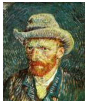
Van Gogh, Autoportret