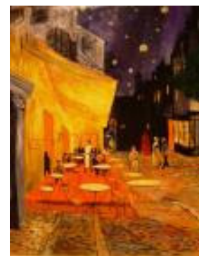
Van Gogh, Cafe Terrace, Place du Forum