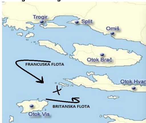
Zemljovid broj 1