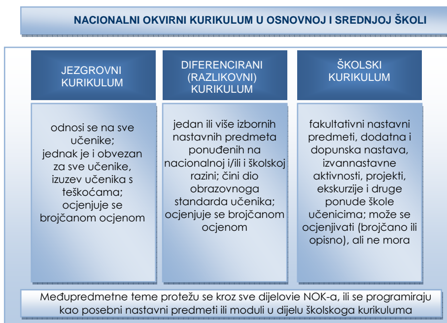
Slika 3. Struktura nacionalnoga kurikuluma u osnovnoj i srednjoj školi

Vodeći se znanstvenim istraživanjima, suvremenim obrazovnim pravcima te polazeći od odredaba Strategije za izradbu i razvoj nacionalnog kurikuluma za predškolski odgoj, opće obvezno i srednjoškolsko obrazovanje (2007.), Mjera za uvođenje obveznoga srednjega obrazovanja u RH (2007.) i čl. 27. Zakona o odgoju i obrazovanju u osnovnoj i srednjoj školi (2008.) Nacionalni okvirni kurikulum pretpostavlja kurikulumsku strukturu jednaku u osnovnoj i srednjoj školi. On se sastoji od jezgrovnoga, diferenciranoga ili razlikovnoga i školskoga kurikuluma (slika 3).