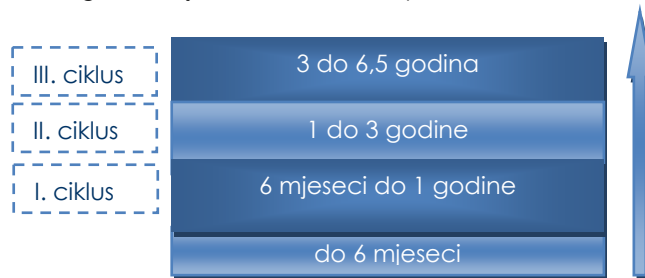
Slika 1. Odgojno-obrazovni ciklusi predškolskoga odgoja i obrazovanja

U skladu s vrijednostima, općim ciljevima i načelima Nacionalnoga okvirnoga kurikuluma težište odgojno-obrazovne djelatnosti tijekom predškolskoga odgoja i obrazovanja usmjereno je na poticanje cjelovita i zdrava rasta i razvoja djeteta te razvoja svih područja djetetove osobnosti: tjelesnoga, emocionalnoga, socijalnoga, intelektualnoga, moralnoga i duhovnoga, primjereno djetetovim razvojnim mogućnostima.