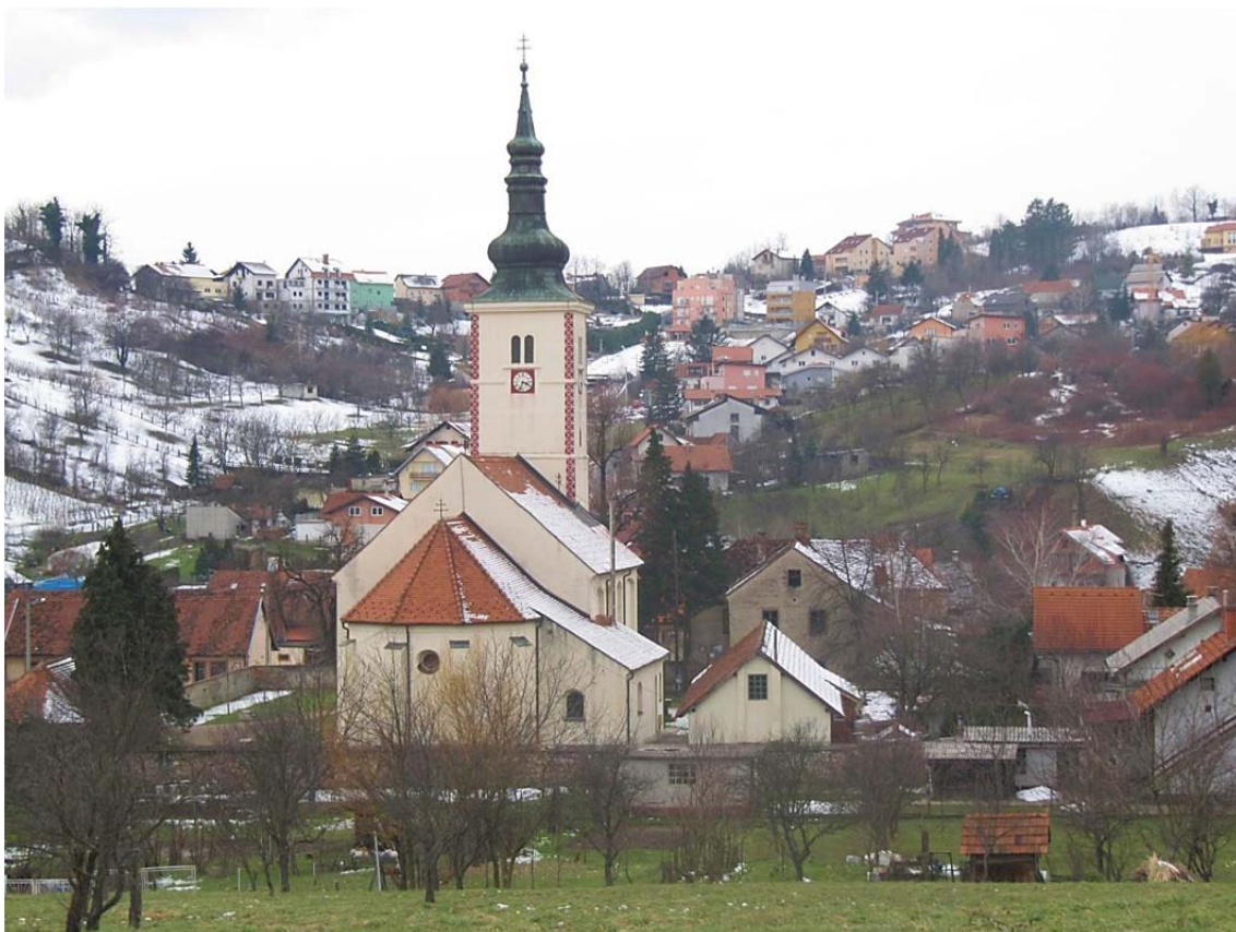
Vrapče - crkva sv. Barbare

Selo Vrapče osnovano je 1217. godine. Nekada se prostiralo od podnožja Zagrebačke gore niz potok Vrabečak sve do Save. Vrapče je najuže vezano sa Zagrebom. Iza Iličke mitnice kod Črnomerca, odmah iza potoka, počinje općina Vrapče. Niz kuća sela Vrapče stoje uz glavnu cestu, dok je sama jezgra s crkvom i školom dosta udaljena od ceste, gdje završava Ilica (tako je bilo godine 1933.).