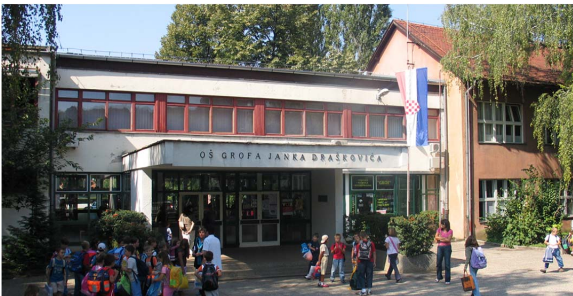
OŠ grofa Janka Draškovića