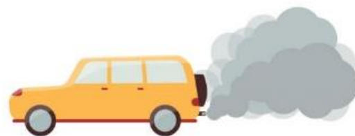
ISPUŠNI PLINOVI AUTOMOBILA