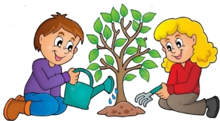
POSADITI STABLO ILI BILJKU