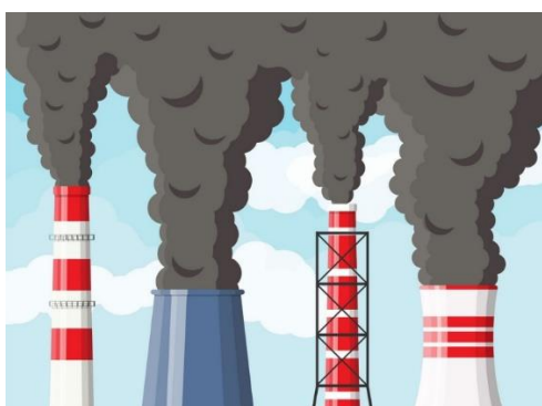
DIM IZ TVORNICA