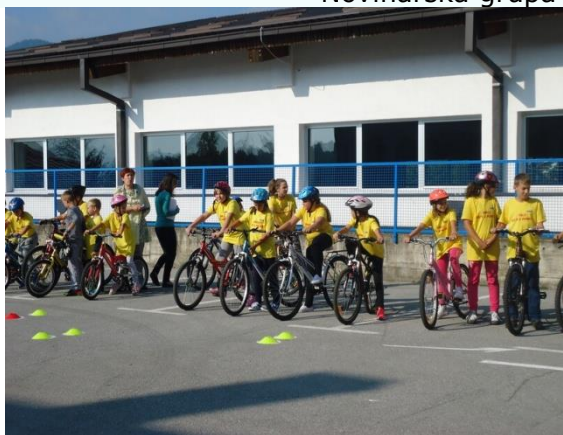
Novinarska grupa „Bongo“

Uz muziku i veselu atmosferu priveden je kraju Europski školski sportski dan koji bi trebao biti poticaj svima da povećaju svoju tjelesnu aktivnost kako bi očuvali i poboljšali svoje zdravlje.