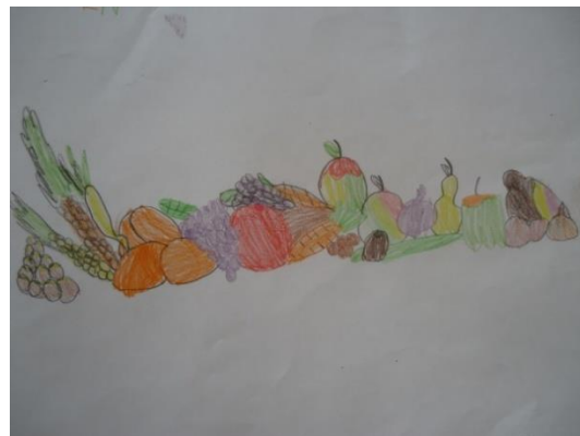
Iris Antić Filipović, 1.r.