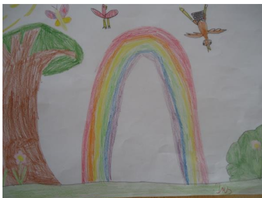
Iris Antić Filipović, 1.r.