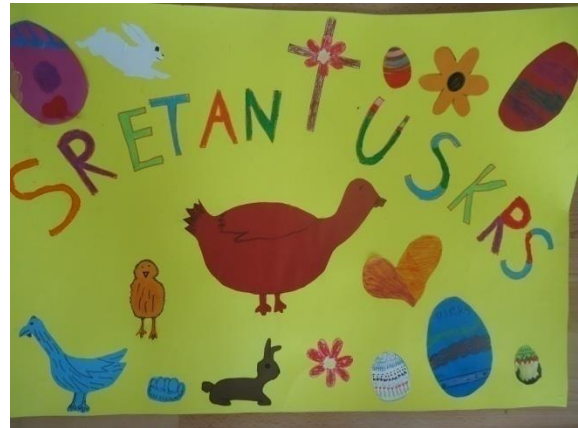
Grupni rad, 4.r.

Sa sobom smo ponijeli sjekiru, čavle, srp i čekić. Jedan član družine je ponio vodu i hranu. Radili smo cijelo popodne. Sjeli smo da se odmorimo i pojedemo, a zatim smo nastavili raditi sve do noći. Morali smo kući na spavanje.