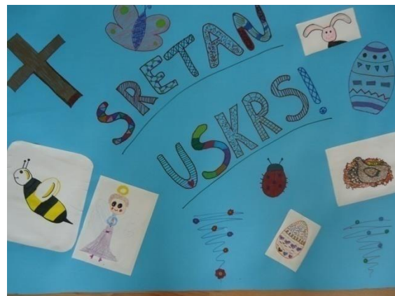
Grupni rad, 4.r.

Drugi dan smo se opet sastali. Veći dio je bio završen. Jedan od prijatelja je morao ranije otići kući, a mi smo nastavili raditi. Slijedeći dan smo se našli pokraj naše kućice i bili smo vrlo ponosni što smo je uspje li dovršiti.