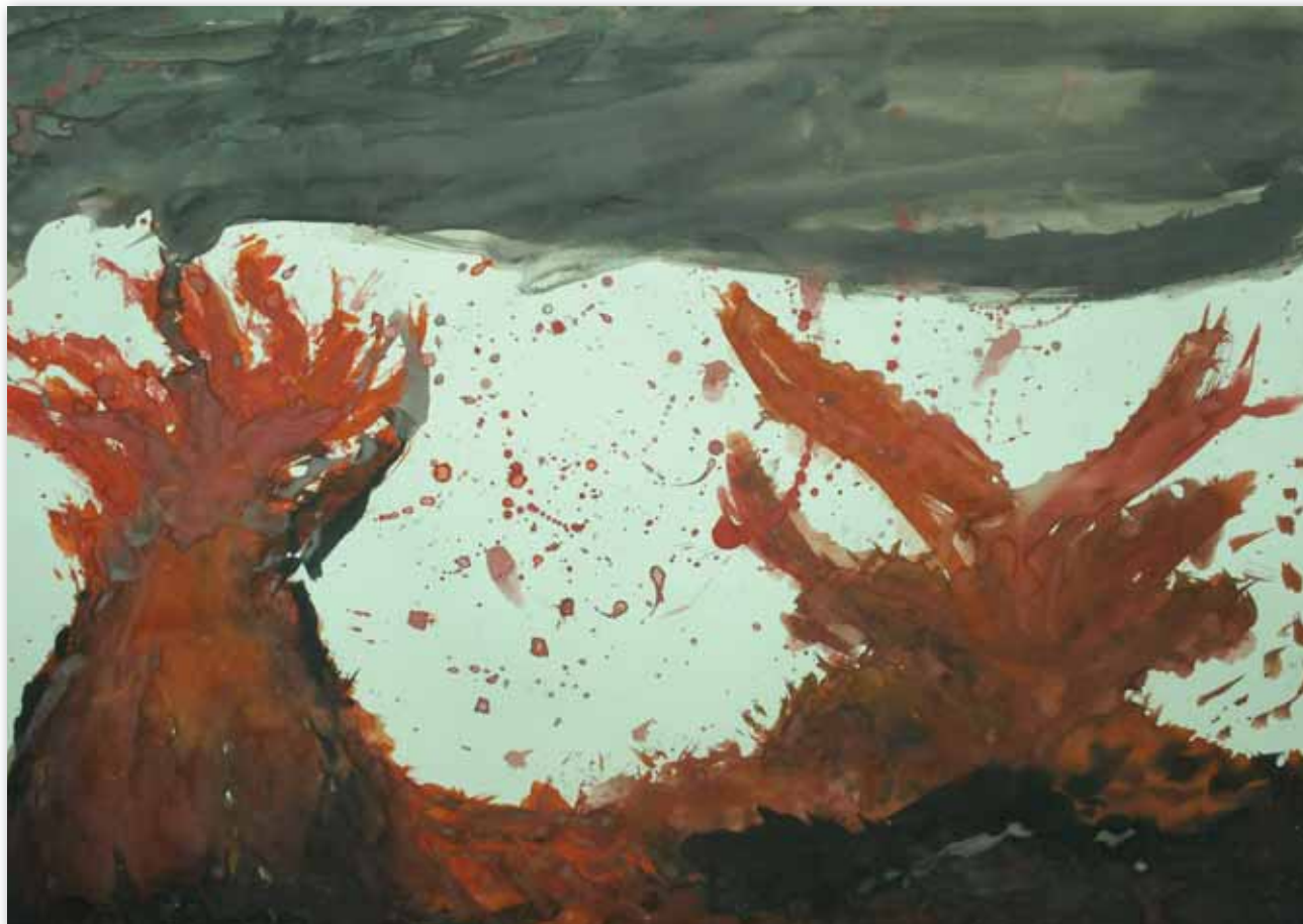
Lorena Lončarić, 6.a razred