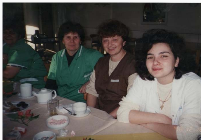
S kolegicama na poslu

Radila sam puno poslova i živjela sam u puno gradova. Najviše poslova i gradova promijenila sam u početku kad sam tek došla. Živjela sam u Frankfurtu, Herrenalbu, Münchenu i u još nekoliko gradova. Radila sam i u tvornici satova, kasnije kao sobarica u hotelu i na kraju kao čistačica u bolnici. Nemam što posebno reći o svakodnevnom životu. Život u