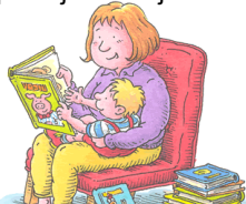
Osnovna škola kralja Tomislava, Našice

Dijete postaje čitatelj u krilu roditelja.