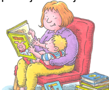
Osnovna škola kralja Tomislava, Našice

Dijete postaje čitatelj u krilu roditelja.