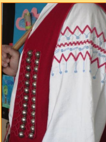
Košulja i prsluk s uresima