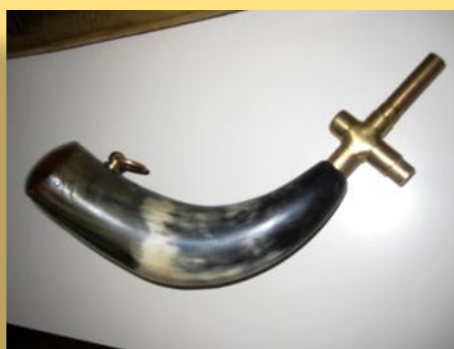
Rog - spremica za barut