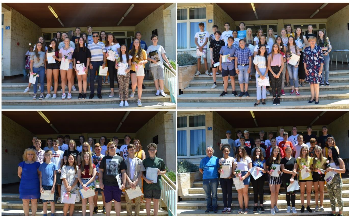
Generacija školske 2019./2020. godine