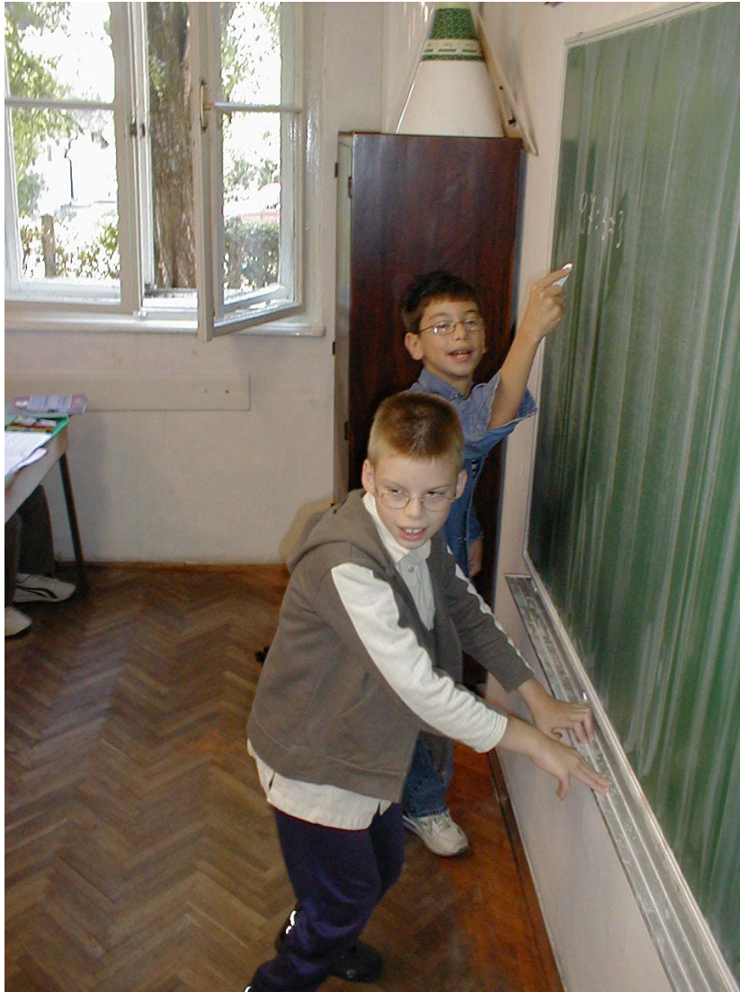
Individualizirani pristup – rješenje i za školu i za učenika

Recimo još ono najvažnije o INDIVIDUALIZIRANOM PRISTUPU I POSTUPCIMA u radu s učenicima s posebnim edukacijskim potrebama. Za razliku od prilagođenog programa, koji preporučuje i dopušta da se redovni program "smanji" i tako učeniku učini laganijim i razumljivim, u prijedlogu individualiziranih postupaka misli se, prije svega, na primjenu onih metoda, sredstava i didaktičkih materijala koji podupiru posebne edukacijske potrebe djeteta (npr., potrebe uvjetovane teškoćama čitanja i pisanja, oštećenjem vida, oštećenjem sluha, cerebralnom paralizom). Evo primjera za dobru praksu!