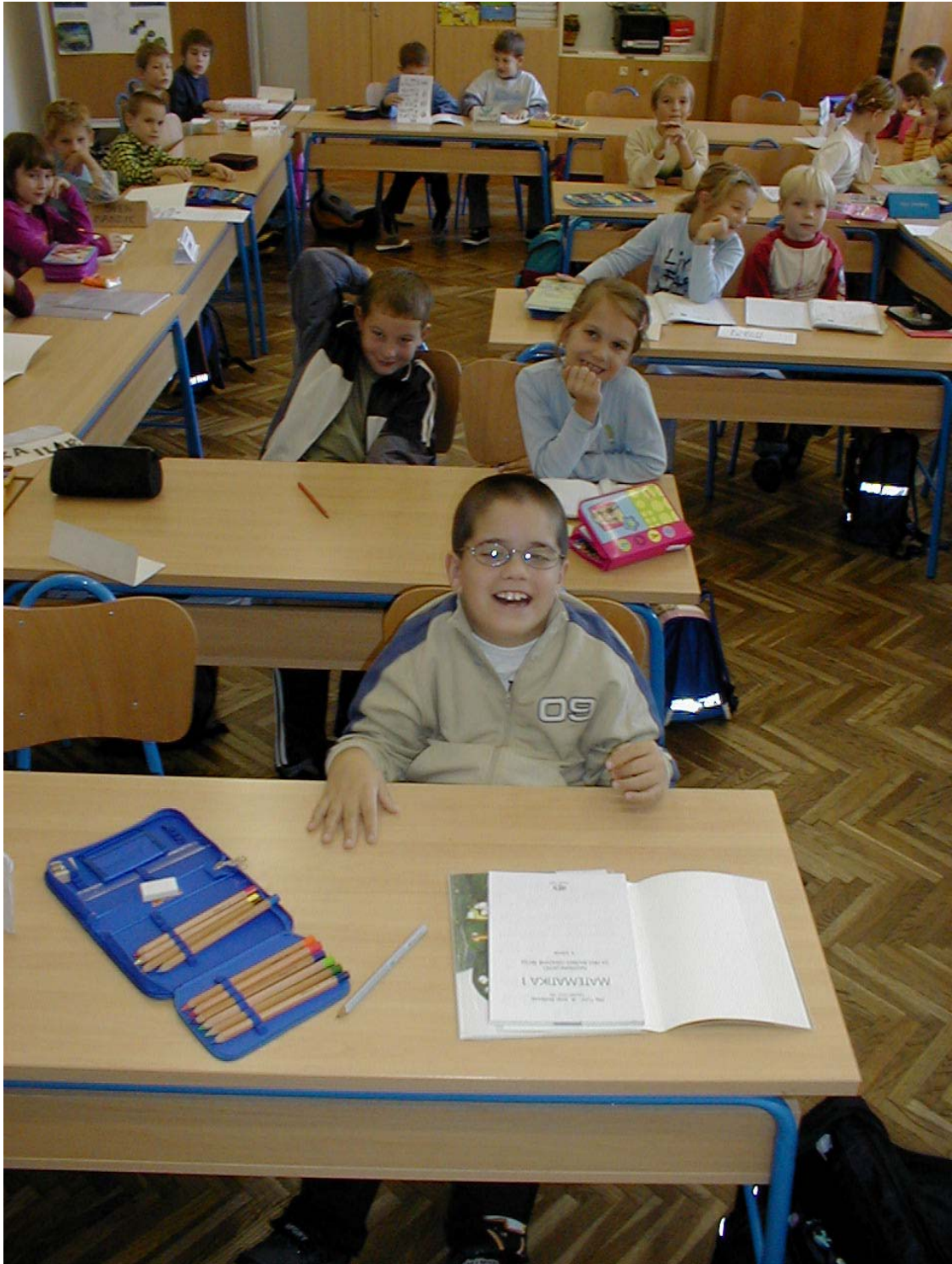
Udruga roditelja PUŽ- podrška integraciji u Osnovnu školu Horvati