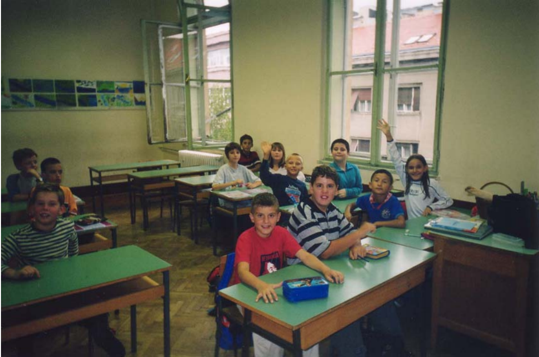
Centar Slava Raškaj podrška uključivanju učenicima s oštećenjem sluha