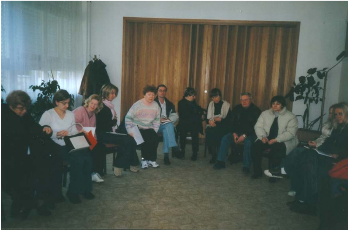
Edukacija roditelja za suradnju