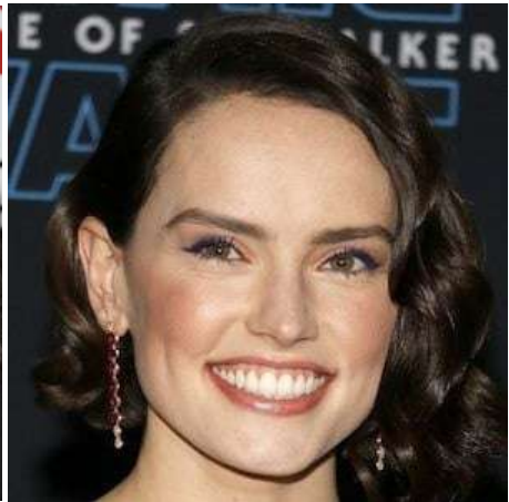
Daisy Ridley (Marguerite)