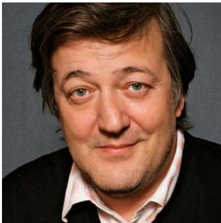
Stephen Fry (Leonardo da Vinci)