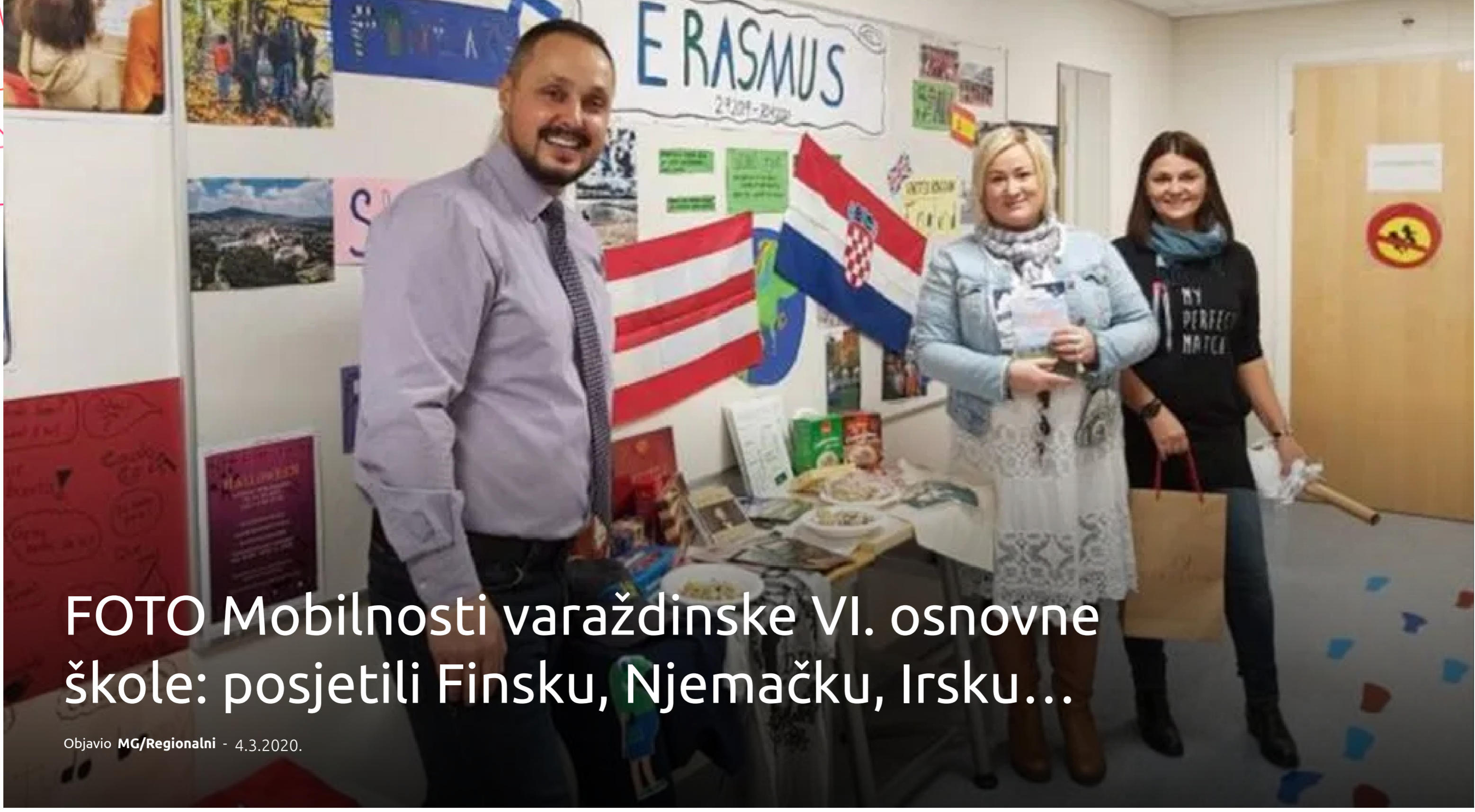
FOTO Mobilnosti varaždinske VI. osnovne škole: posjetili Finsku, Njemačku, Irsku...