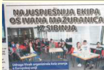
Kviz "Koliko znamo o Europskoj uniji?"

najboljom pjesmom naše županije. Nakon svečane podjele nagrada mali pjesnici su krenuli u obilazak grada Zagreba i divili se svim ljepotama koje taj velegrad nudi. Nastavnici su imali čast ostati na predavanju koje je za njih bilo priređeno. Slijedila je zakuska kojom su predstavljena umijeća zagrebačkih kuhara nakon čega smo se vlakom vratili kući. Umorni i puni doživljaja izmijenili smo dojmove i zaključili da je svagdje lijepo, ali doma najljepše. Tena Gunčević, 8.a