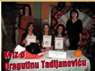
Kviz o Dragutinu Tadijanoviću