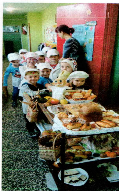
Fotografija 4. Mali pekari i kuhari povodom Dana kruha i plodova zemlje