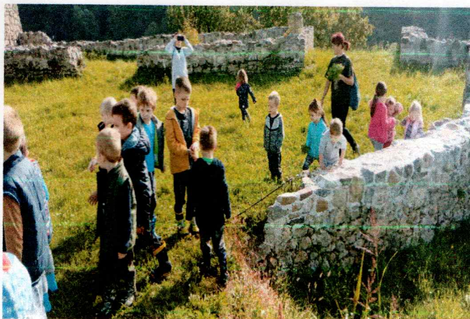
Fotografija 1. Mali likovnjaci modelirali su sebe s plastelinom koji su sa tetama sami zamijesili Fotografija 2. Izlet na zidine Starog grada Sirača