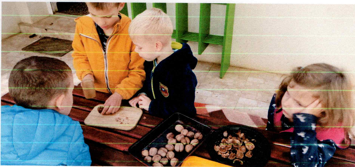
Fotografija 9. MRA (male radne aktivnosti) zabavno je bilo sakupljati orahe u našem parku, a još zanimljivije razbijati ljusku i saditi se jezgrom