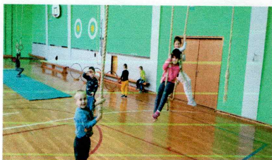
Fotografija 3. Nema veze što je kiša vani, mi vježbamo u školskoj dvorani