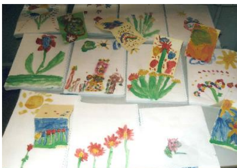
Fotografija 11. Naši mali likovni umjetnici