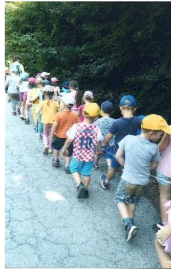
Fotografija 14. Povratak sa izleta