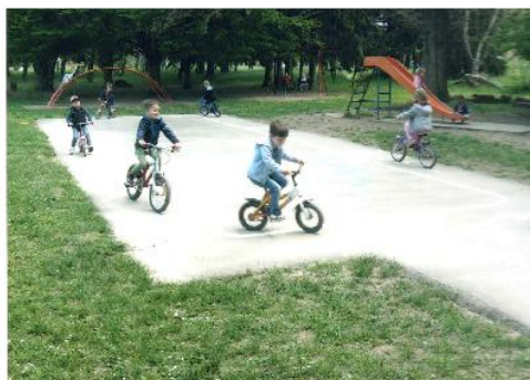
Fotografija 2. Uz tete u vrtiću naučili smo voziti bicikle bez pomoćnih kotača