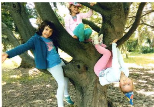
Fotografija 7. Odmor na tzv. „majmunskom drvetu“ na kojem petog. i šestog. savladavaju vještine penjanja, višenja i silaženja