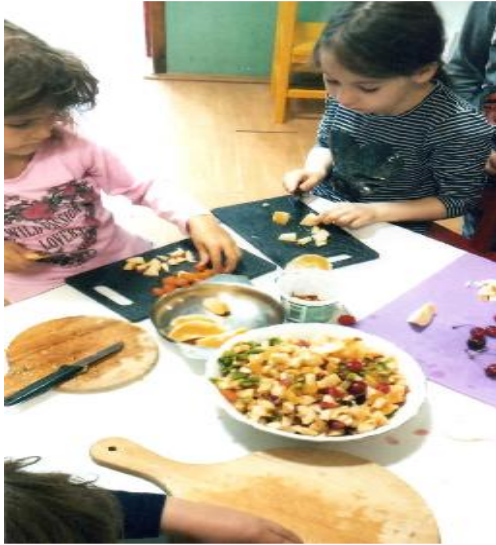
Fotografija 13. Što možemo sami?! Priprema voćne salate s medom i limunom.