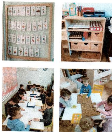
Fotografija 15. Kutak matematike