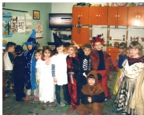
Fotografija 3. Dan karnevala kada možemo biti što god poželimo