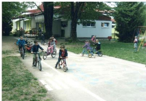
Fotografija 1. Biciklijada vrtičevaca