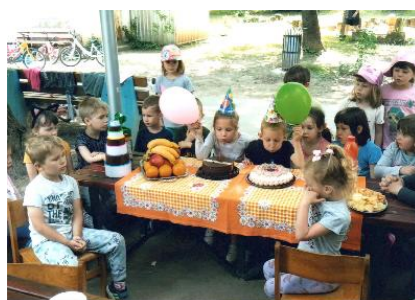
Fotografija 12. Dvostruko rođendansko slavlje – proslava rođendana u vrtiću djeci je veoma važna