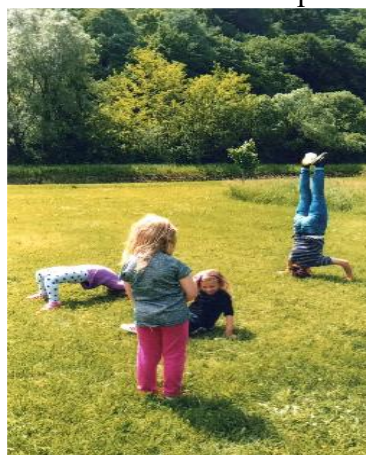
Fotografija 4. Vježbanjem do zdravlja ( stoj na glavi-teta, zvijezde, igre na livadi u blizini odbojkaškog igrališta