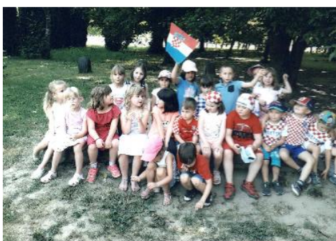
Fotografija 9. Recitali smo, pjevali i Vježbali uz naše HR reprezentativce