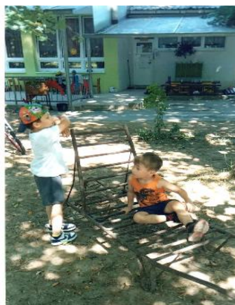
Fotografija 8. I na trakaču se može odmoriti