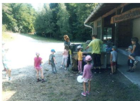
Fotografija 5. Sportske igre na Izletištu Krčevina