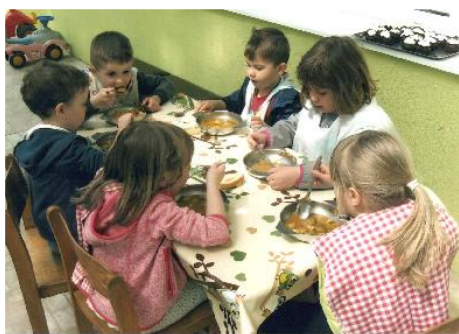
Fotografija 10. Zdravom prehranom jačamo imunitet i borimo se protiv korone.