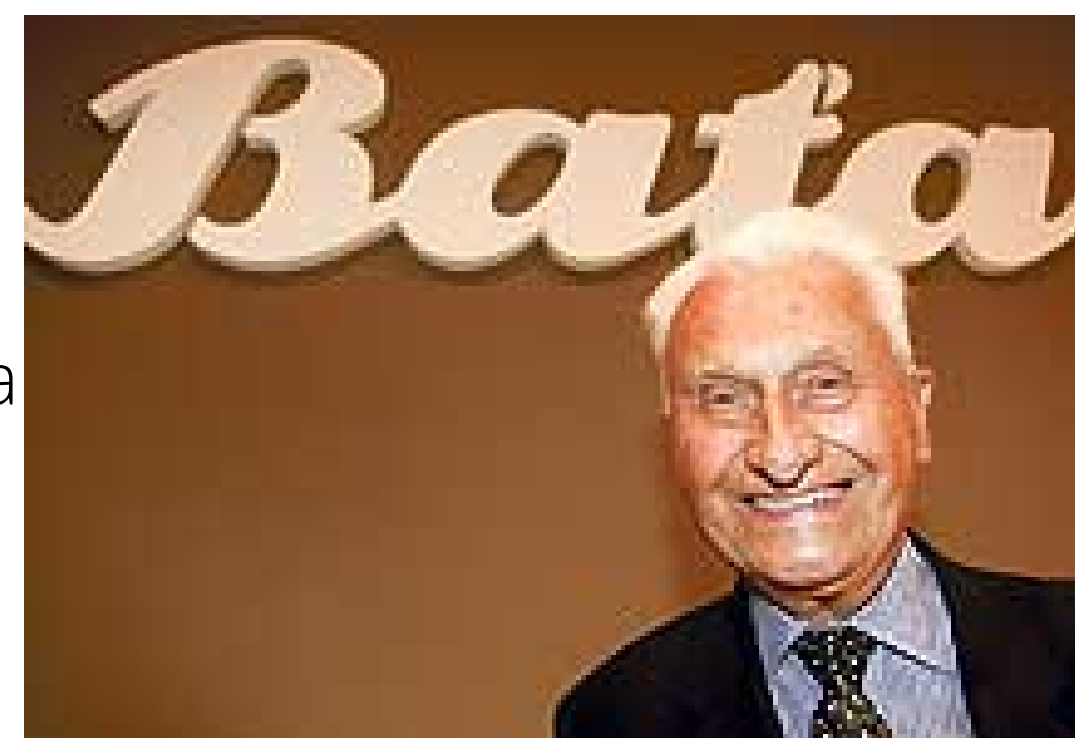
Tomaš Bata - proizvođač obuće Bata