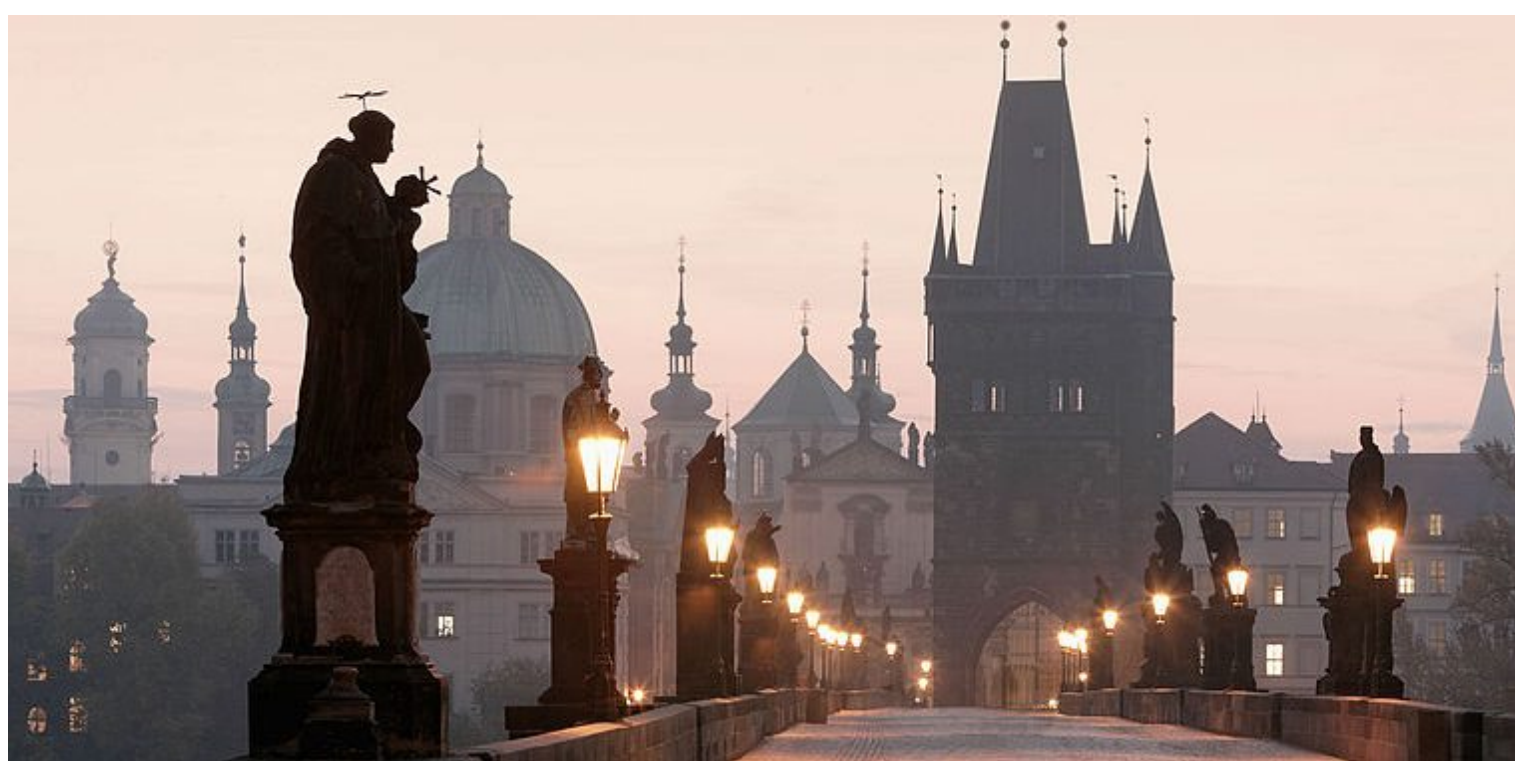
Karlov most- 30 kipova i statua