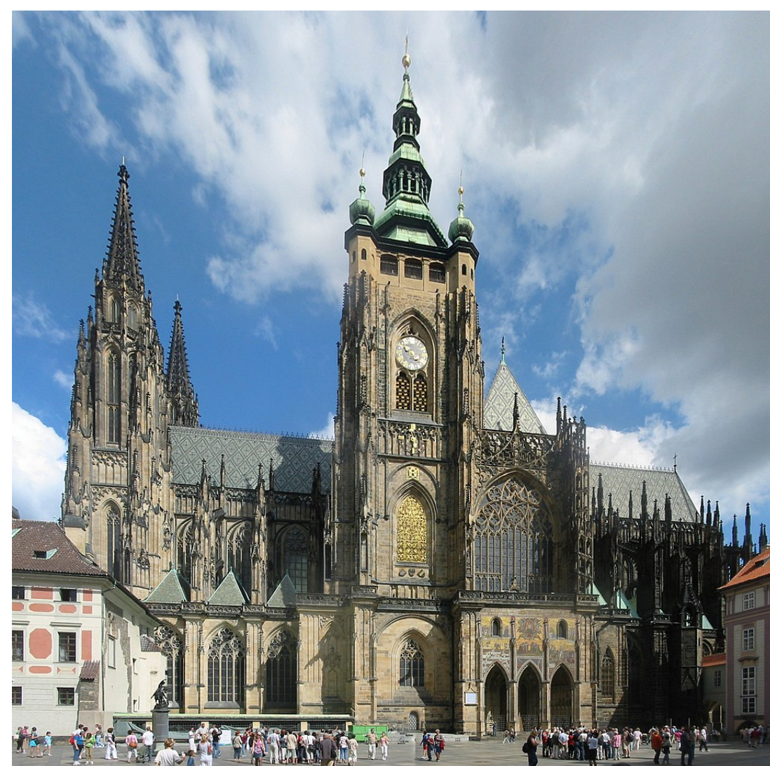
Katedrala sv. Vita u praškom dvorcu