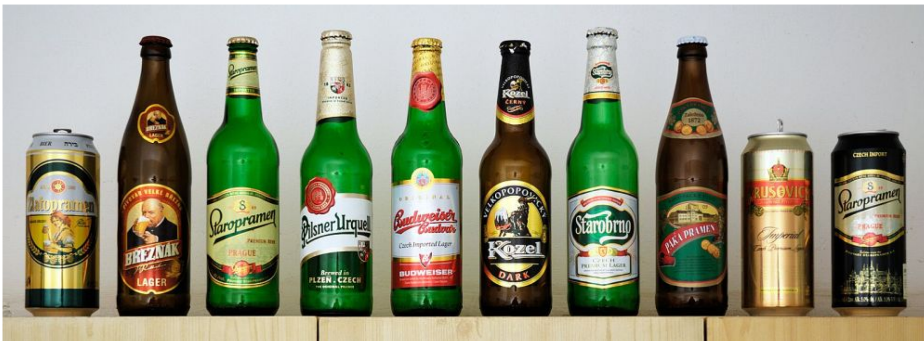
Poznata češka piva; Kozel, Pilsner Urquell, Kruševice, Staropramen..