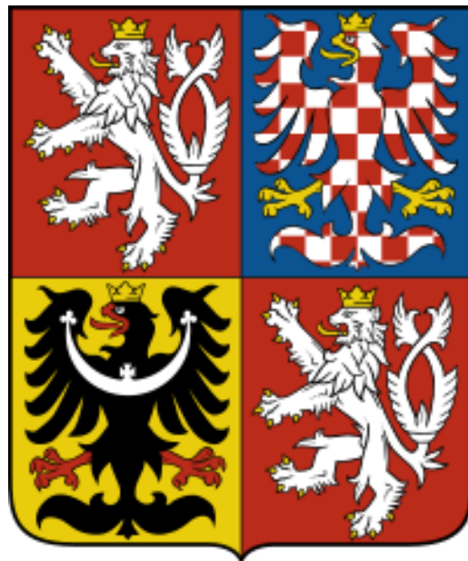
Državni grb Češke