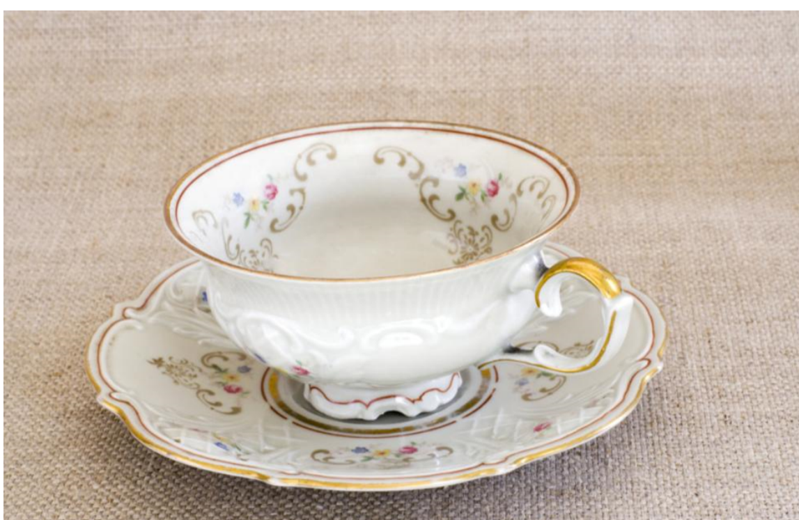
U karlovarskom kraju razvijena je proizvodnja porculana.