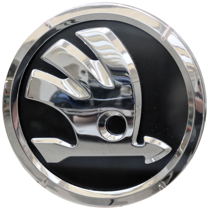
Škoda Auto a.s. je najveći proizvođač automobila u gradu Mlada Boleslav