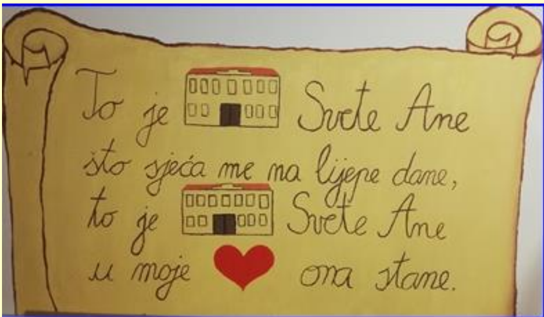
Osnovna škola Svete Ane u Osijeku