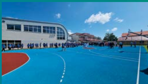
Obnovljeno igralište OŠ Gola