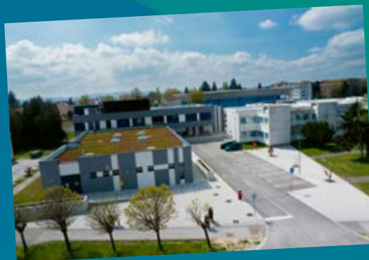
Centar kompetentnosti u Koprivnici

Koprivničko-križevačka županija kontinuirano kreira i prati projekte s ciljem omogućavanja jednake dostupnosti obrazovanja, poticanja izvrsnosti učenika, brige o zdravlju i zdravim navikama djece.