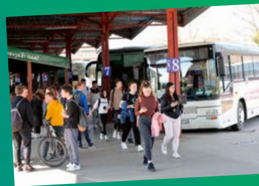
Prijevoz učenika srednjih škola