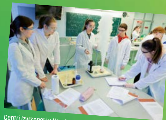
Centri izvrsnosti u Koprivnici, Križevcima i Đurđevcu

Priprema dokumentacije za novi investicijski ciklus - prijava na EU fondove, stvaranje još boljih materijalnih uvjeta obrazovanja.