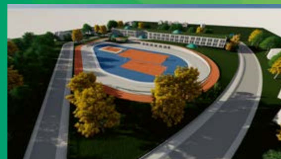
Buduća zgrada Srednje škole Koprivnica