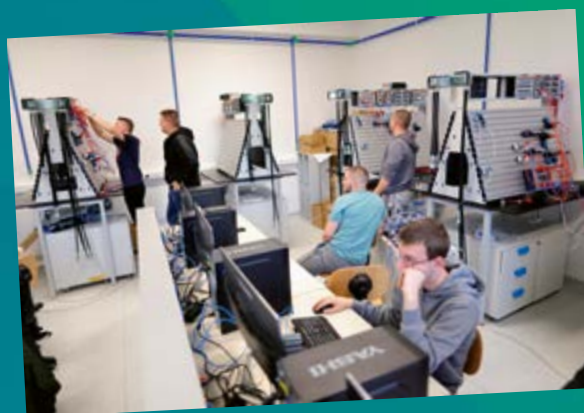
Nova oprema u Centru kompetentnosti u Đurđevcu