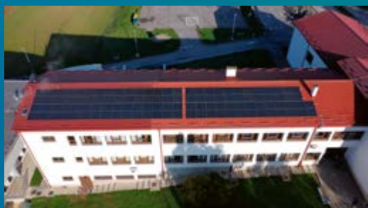
Elektrana na zgradi OŠ Sveti Petar Orehevec