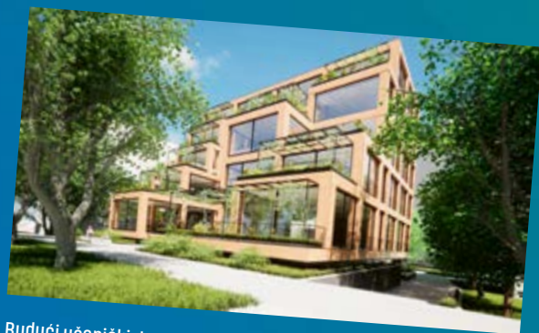
Budući učenički dom u Koprivnici