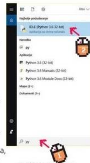
Slika 2b.1. Pokretanje programskog jezika Python