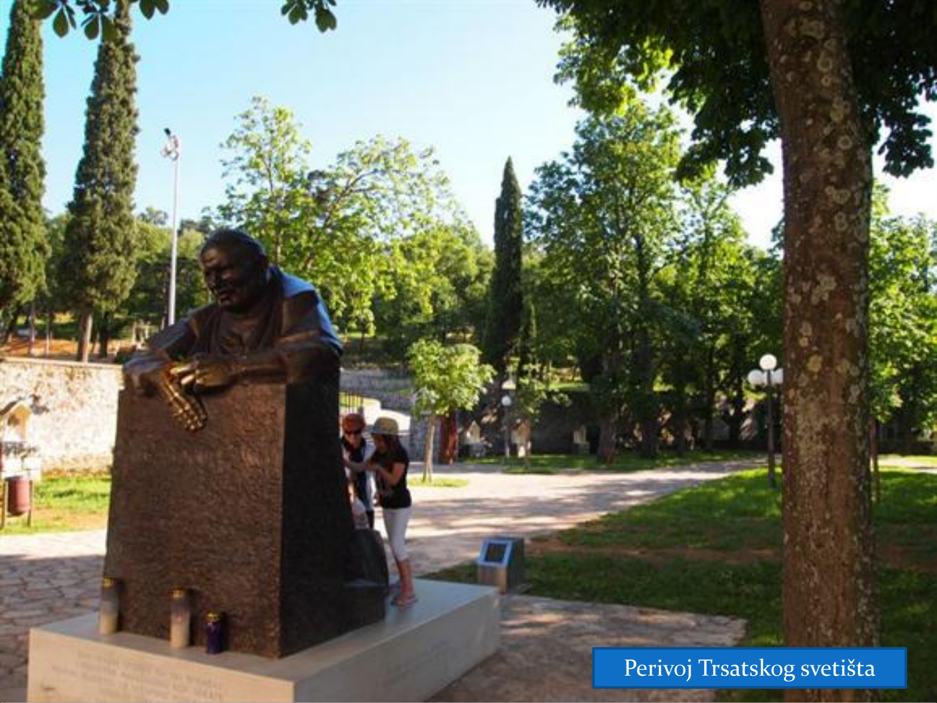
Perivoj Trsatskog svetišta