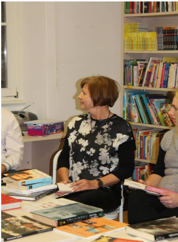
Slika 3. Predstavljanje radionice, izvor: Valentina Hasimi