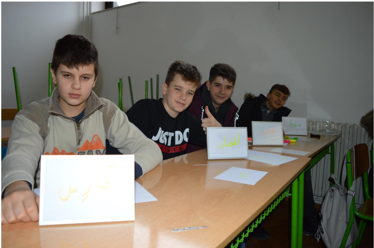
Radionica arapskog jezika i izrada levhi