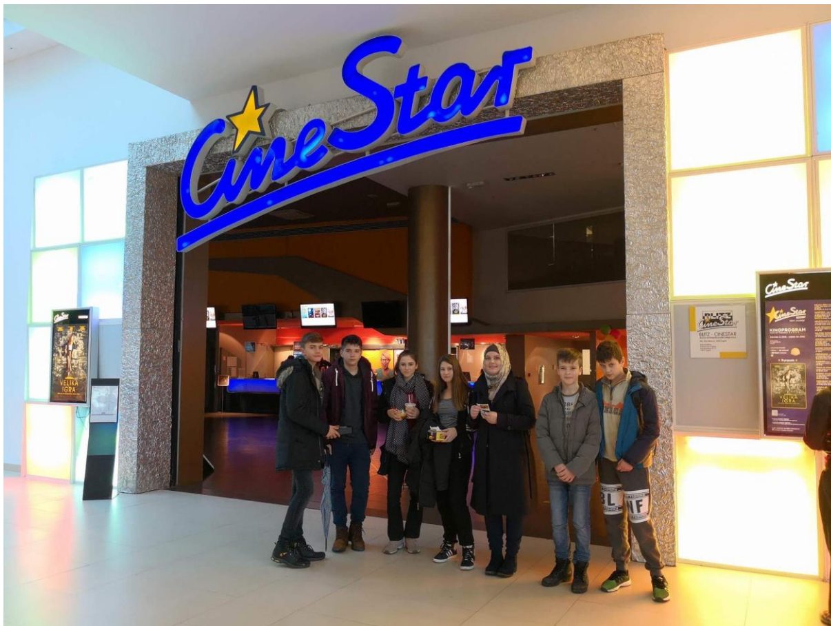
Vrijeme odmora iskoristili smo za gledanje filma Jumanji

Zimska škola je zatvorena svečanošću na kojoj su predstavljeni svi polaznici i kojima su uručene pohvalnice za trud i angažman u zimskom kampu.