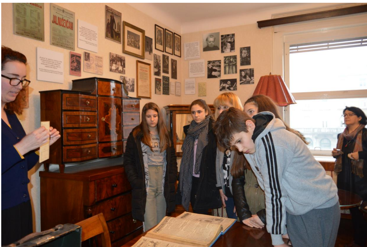
Stan Marije Jurić Zagorke na Dolcu