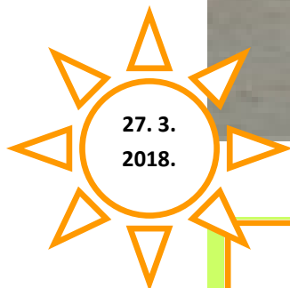
Gotovi uratci s radionica