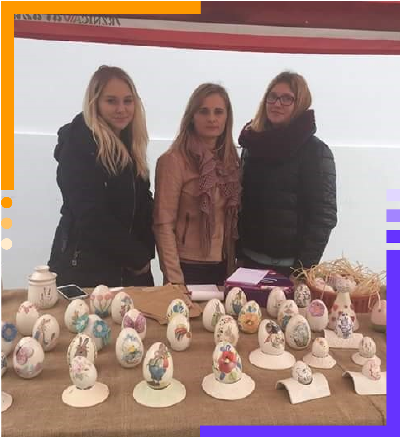
Prigodna prodaja za Uskrs na Gradskoj tržnici Varaždin