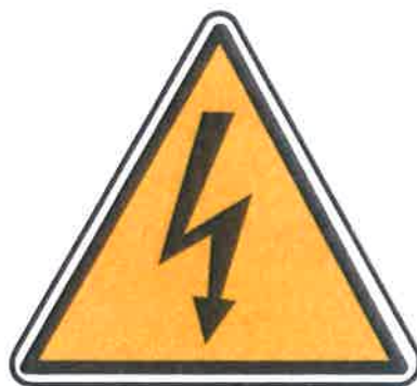
Znak za opasnost od visokog napona