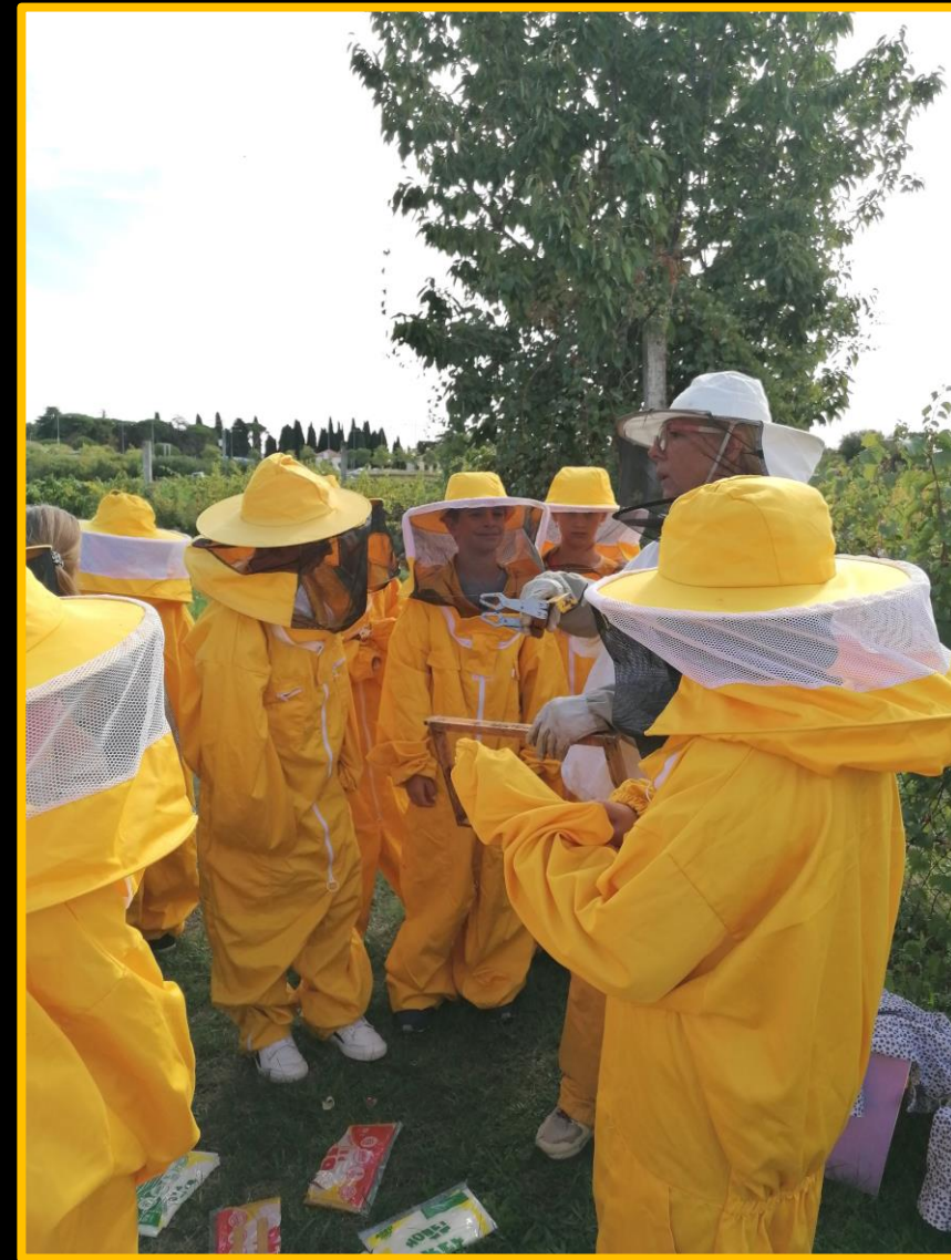
Okvir za saće, rad pčelica, med u saću...