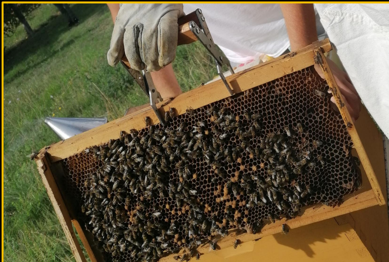
Pčele: radilica, trut i matica