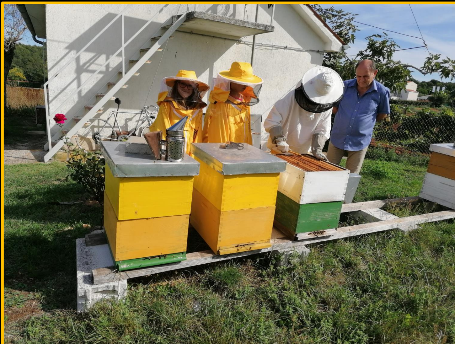
Pčelar – pčelinjak – košnica – pčele - saće - med