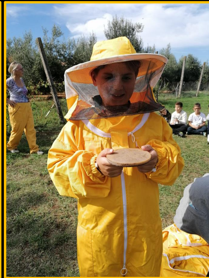
Medene pogačice za prehranu pčela u zimskim mjesecima