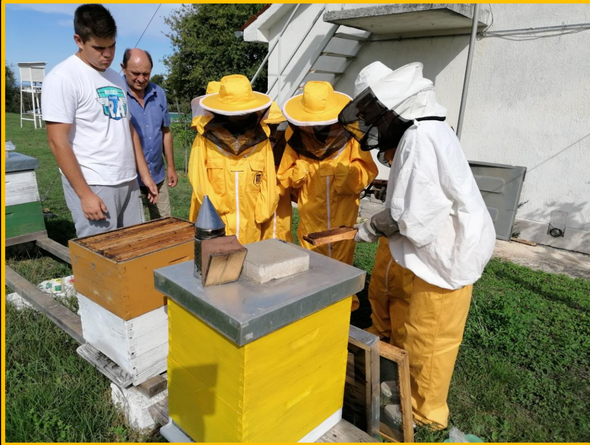
Pčelarska oprema: pčelarsko odijelo, rukavice, šešir s velom, obuća, dimilica i pčelarsko dlijeto.