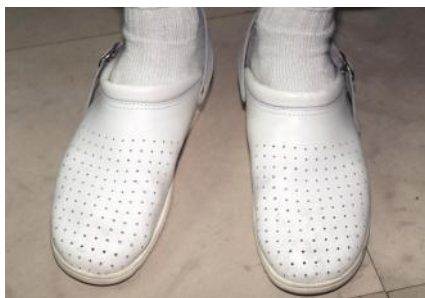
Slika 2. Osobno zaštitno sredstvo za zaštitu nogu – obuća

Tipičan primjer su „klompe“, natikače, cipele s plastičnim đonom, sandale i slično, što je potpuno neprikladno za rad u zdravstvu jer nosi velik rizik od padova, poskliznuća, što može imati za posljedicu i ozbiljne ozljede.