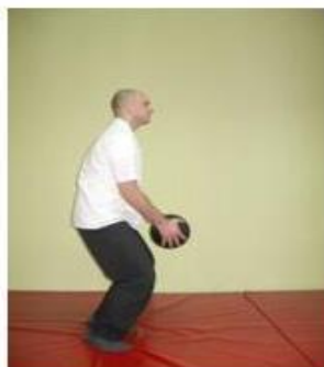
4. ustajanje iz čučnja sa teretom