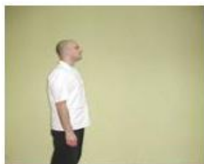
1. početni položaj