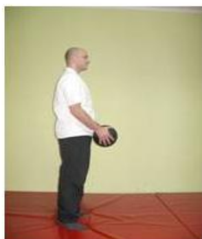
5. stojeći položaj sa teretom