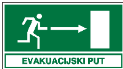
Slika 3. Oznaka puta za evakuaciju