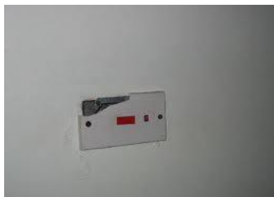
Slika 8. Oštećeni utikač

Priključnice i utikači vrlo su osjetljivi na udarce i padove.