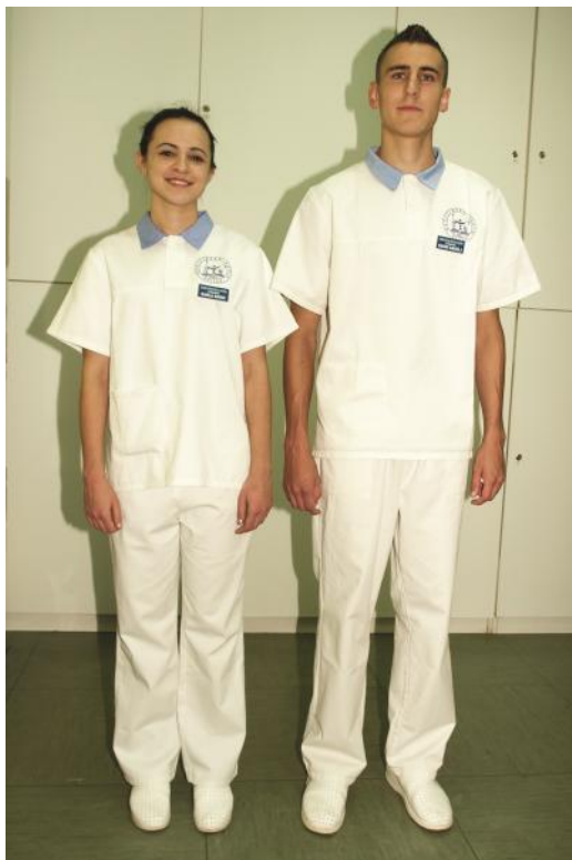
Slika 1. Osobno zaštitno sredstvo za zaštitu tijela – uniforma