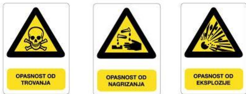
Slika 13. Znakovi opasnosti od trovanja, nagrizanja i eksplozije