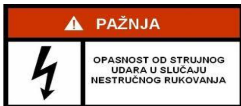
Slika 4. Znak opasnosti od strujnog udara

Vodite računa da sigurnost bolesnika ovisi o ispravnosti opreme i njezinoj pravilnoj uporabi.