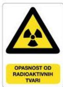
Slika 12. Znak opasnosti od radioaktivnih tvari

Djelovanjem zračenja na čovjeka nastaju različita oštećenja koja možemo podijeliti u dvije skupine. Prva skupina su oštećenja koja se javljaju na tijelu ozračene osobe. To su somatska oštećenja. Što su stanice nezrelije i brže se dijele, osjetljivije su na zračenje. Najosjetljivije su koštana srž, limfne i spolne žlijezde, leća oka, sluznice, krvne žile, štitna žlijezda i koža, a manje osjetljivo je koštano, mišićno i živčano tkivo. Druga skupina su oštećenja koja se javljaju na potomcima ozračenih osoba, a nastaju zbog promjena nasljednih osobina izazvanih djelovanjem zračenja na spolne stanice. To su genetska oštećenja.