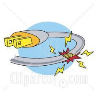
Slika 6. Oštećeni kabel

Natezanje, povlačenje vodiča preko predmeta s oštrim bridovima, prignječenje, visoka temperatura, razne kemikalije, a naročito kiseline vrlo brzo mogu oštetiti sloj izolacije vodiča.