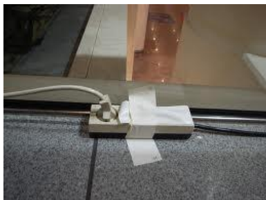
Slika 7. Položeni nezaštićeni produžni kabel