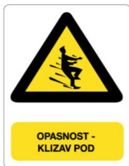
Slika 10. Oznaka opasnosti od klizavog poda

Tehnika pravilnog podizanja tereta, u našem slučaju bolesnika, sastoji se u sljedećem: