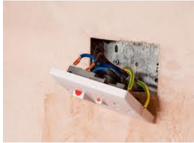
Slika 5. Oštećeni prekidač